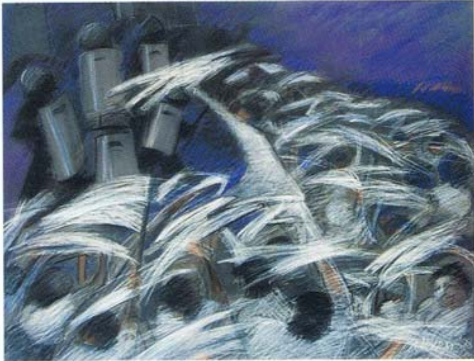
Viernes Negro II 19.5" x 25.5" Pastel 1989