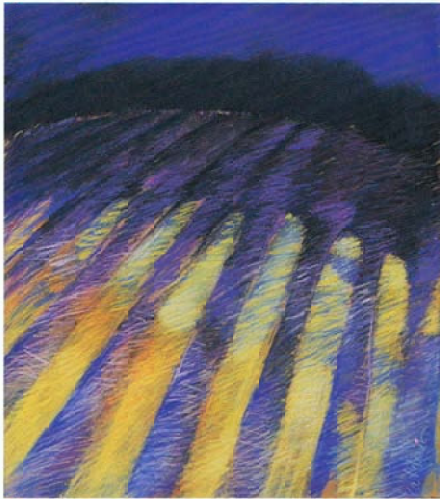
Siembra y Sombra 23" x 19.75" Pastel 1991